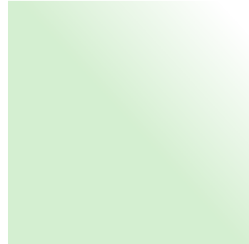
Pale green | Zartgrün