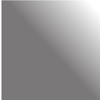
Steel gray | Stahlgrau