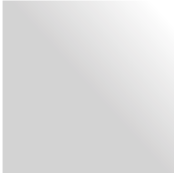
Crystal | Kristall

Pictures show only exemplary the glass colors. | Abbildungen zeigen nur exemplarisch die Glasfarben.