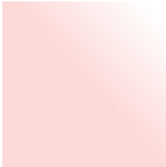
Rosaline | Rosalin