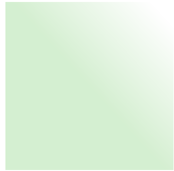
Pale green | Zartgrün