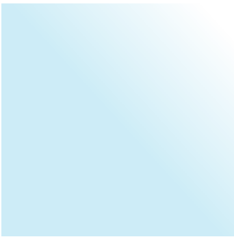
Aquamarine | Aquamarin